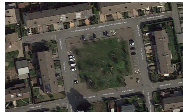
Localizzazione parco giochi inclusivo